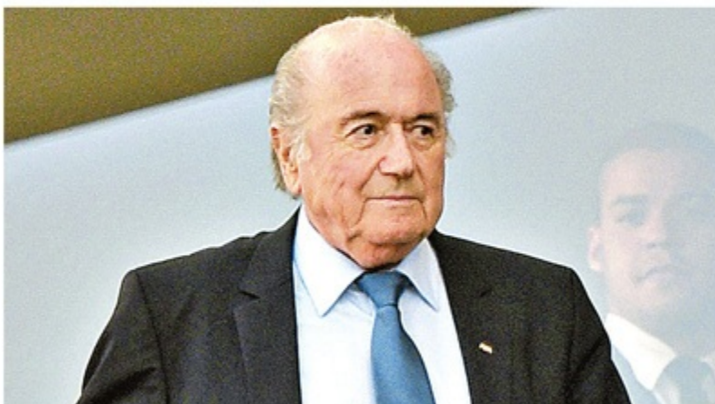
Abertura Blatter abre Fifa Masters Alumni, no Rio

– Posso dizer que a Fifa nunca fez um controle antidoping tão rigoroso. Todos os jogadores fizeram testes de urina e sangue. A falta de um laboratório no país atrapalhou,